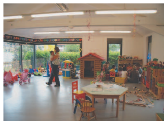
Semaine du 16.05.11