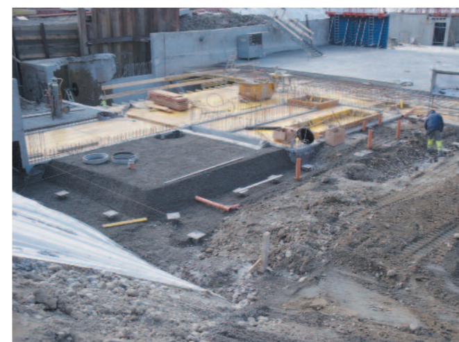
Semaine du 28.02.11

quelques clichés depuis la grue, ce qui permet de voir l'ampleur de ce chantier. Nous les en remercions vivement. En ce qui concerne les palplanches qui se trouvaient côté route de Lausanne, elles ont été retirées début mai. Le parking des riverains est donc à nouveau accessible.