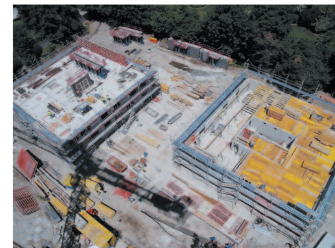
Semaine du 16.05.11