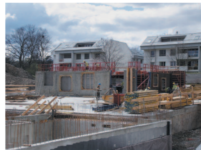
Semaine du 28.03.11