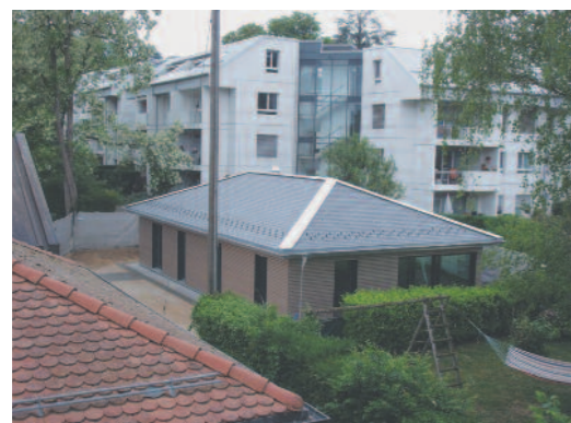
Semaine du 09.05.11

Afin de fêter dignement leurs 15 ans d'activité au sein de notre commune, et inaugurer officiellement le chalet, une fête est prévue le samedi 17 septembre 2011.