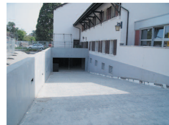
Semaine du 09.05.11